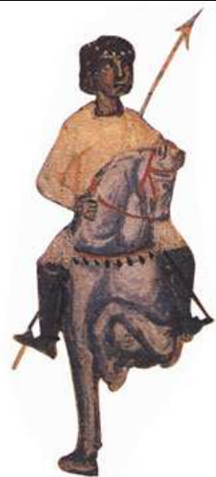
Raimbaut de Vaqueyras