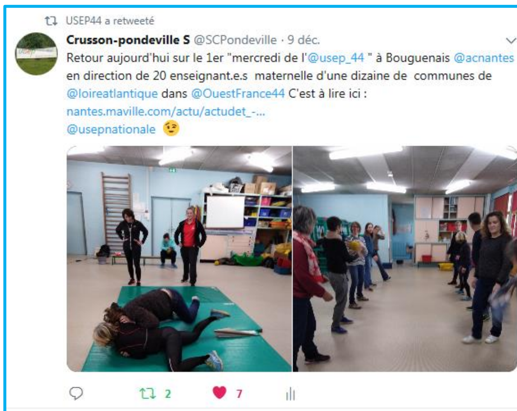
Collaboration fructueuse pour la journée de la solidarité