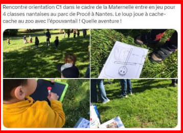
Rencontre orientation C1 dans le cadre de la Maternelle entre en jeu pour 4 classes nantaises au parc de Procé à Nantes. Le loup joue à cache-cache au zoo avec l'épouvantail ! Quelle aventure !

Pour faciliter l'inclusion des enfants en situation de handicap sur vos rencontres, le lien vers une fiche navette qui vous aidera.